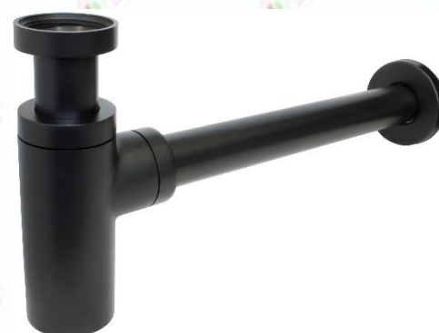
Immagine a puro scopo illustrativo.