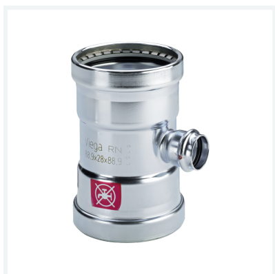
Prestabo XL-T-komad sa tehničkim rješenjem SC-Contur Model 1118XL Artikl 597 832