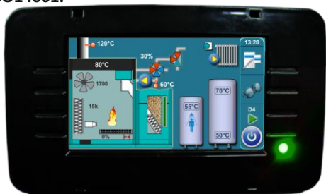
Multifunkcijska digitalna regulacija s ekranom osjetljivim na dodir